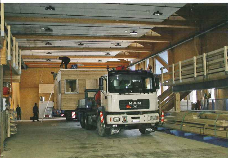
Le local de garde au moment du chargement

chaient toute approche depuis la droite. La grue a pu fixer les chaînes sur les 2 renforts en acier se trouvant sous la base de l'édifice et lever le tout à la verticale.