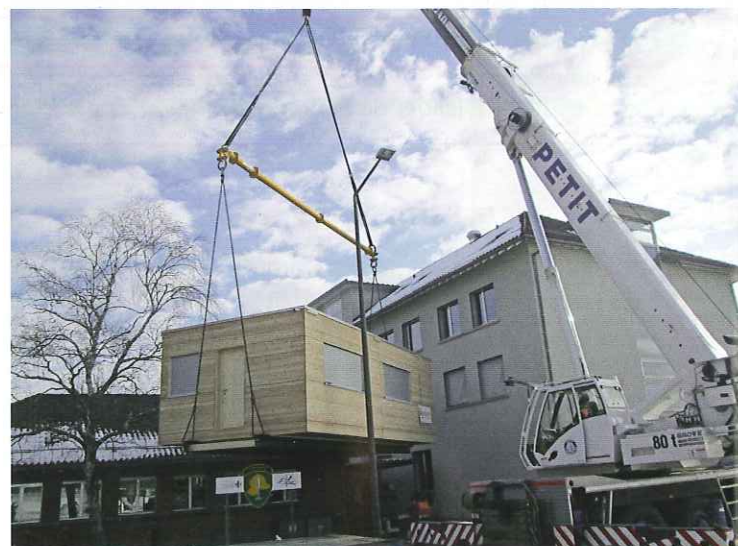
La mise en place a demandé beaucoup de précision

Nous avons pu relever le défi que la mise en place a demandé. Le chemin d'accès au déchargement n'étant plus celui décidé initialement, le contremaître a dû demander en renfort un camion grue afin de pouvoir accéder avec précision sur l'emplacement définitif du local. En effet, l'ouvrage est venu se loger devant deux bâtiments existants. Des regards dans le sol, ainsi que les arbres empê-