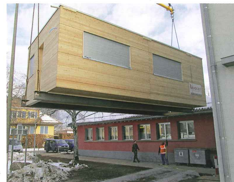
Mise en place du local sur les fondations