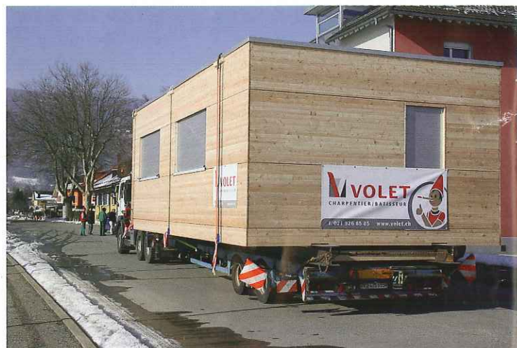
Arrivée du convoi sur le lieu de déchargement

Le convoi s'est effectué par un transporteur routier, moyennant une remorque surbaissée. Etant donné la largeur de l'ouvrage, il a fallu s'accompagner de la gendarmerie vaudoise pour libérer les routes d'accès au chantier. Ce local est composé d'une structure en bois isolée, ha-